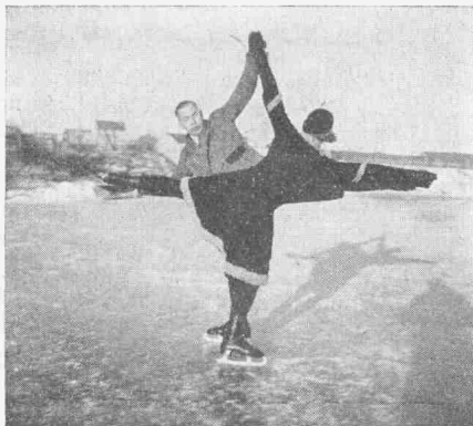
F. C. K. nebst Partnerin auf dem Aschhof

Kein Meister fällt vom Himmel, alles muß gelernt sein. Das Fallen ist eine angeborene, menschliche Schwäche. Diese Sätze prägte ich mir vorher genau ein, überlegte und kam zu dem wichtigsten Resultat: Dem Mutigen gehört die Welt! Tagelang stand ich als kleiner Bub an den Eisbahnen und bewunderte die Menschenkinder, die auf der glatten Fläche auf diesen schmalen Stahlschienen herumflitzten. Als einziger Sohn in der Familie durfte ich ja nicht auf's Eis. Es gab da eine ganze Reihe von: Es könnte etwas passieren, oder ein rechter Junge sitzt am Ofen und zählt die Kacheln, oder der Onkel war auch schon einmal bei Mondfinsternis in der Regentonne eingebrochen.