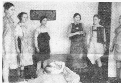
Ein Bild aus dem Weihnachtsspiel