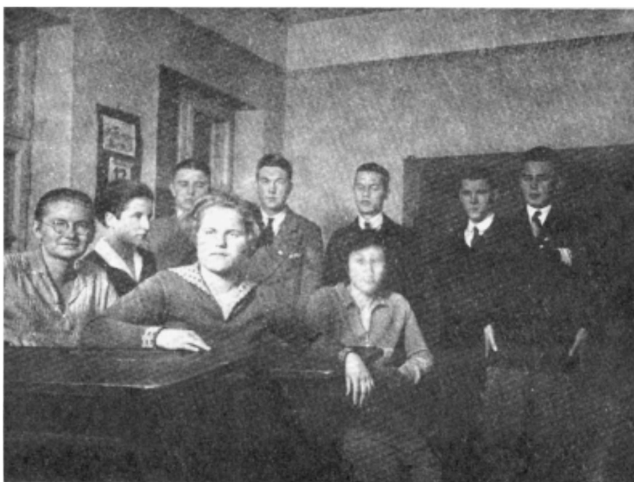
Abiturienten der Herderschule 1929