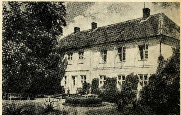
Das Baubelner Gutshaus lag inmitten eines malerischen Parkes.