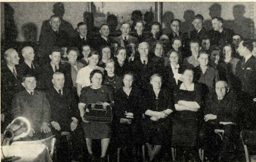
Die Essener Memelländer stellen sich vor