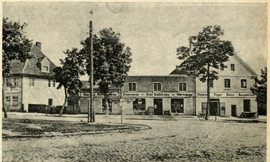
Kennen Sie das Kirchdorf im Kreise Memel?

Dann das Lager Eisenach! Wir wurden freundlich empfangen und bewirtet. (Fortsetzung Seite 3)