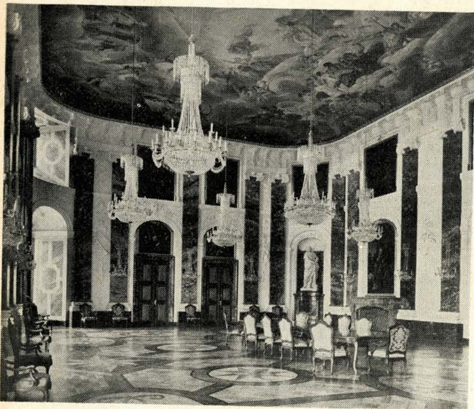
Rittersaal des Mannheimer Schlosses

Der Alleinspieler kann sein Spiel nie verlieren, wenn er auf die erste ausgespielte Karte den zurückgehaltenen König abwirft. Dann können die Gegenspieler nur noch auf den Kreuz Buben einen Stich machen und können im günstigsten Falle aus dem Schneider kommen. Es gibt noch eine andere Lösung, die in der Durchführung jedoch wesentlich schwieriger ist und dem Alleinspieler keine höhere Gewinnstufe einbringt.